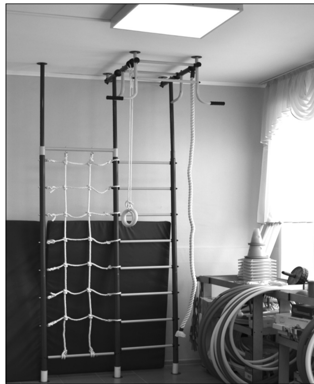
Детские спортивные тренажеры в кабинете лечебной физкультуры.

Основные средства федеральной поддержки, как пояснил Виталий Титов, были направлены на обновление и оснащение новым спортивным оборудованием и спортивным инвентарем школьного спортивного зала,