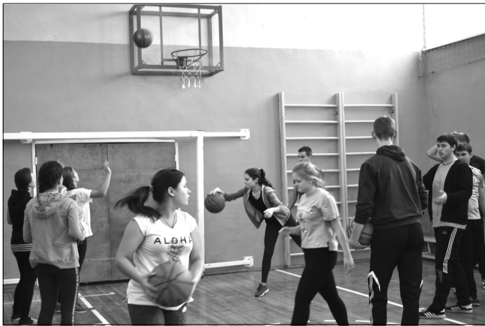
Урок физической культуры. Старшеклассники играют в баскетбол. Новые баскетбольные щиты из оргстекла «в деле».

Чтобы спортклубовцев из «Олимпа» узнавали, заказаны 30 манишек, 20 комплектов спортивной футбольной формы с эмблемой, а также два флага. Если придется отстаивать честь своего спортивного клуба в спортивных соревнованиях, то лучше делать это с гордо развевающимся над головой флагом и при этом одинаково выглядеть. И, по всей видимости, участвовать в соревнованиях, съездах, семинарах и форумах ребятам из «Олимпа» придется часто. Впереди их ждут мероприятия различного уровня. Кстати, недав-