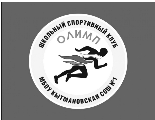
Эмблема спортивного клуба «Олимп».

В Кытмановской средней школе №1 появился свой спортивный клуб «Олимп». Главное управление образования и науки Алтайского края согласно распоряжению Правительства Российской Федерации от 28.04.2016 №803-р определило ряд образовательных учреждений, которым планируется выделить по полмиллиона рублей из средств федерального бюджета на развитие школьных спортивных клубов. Среди школ, попавших в этот список, Кытмановская СОШ №1. В прошлом учебном году за спортивные заслуги учащихся в таких видах спорта, как футбол, легкая атлетика, спортивное ориентирование, школа вошла в десятку сильнейших образовательных учреждений региона по развитию физической культуры и спорта, за что была награждена специальным дипломом и кубком. А несколько месяцев спустя, в том числе благодаря этому, автоматически попала в федеральную программу и получила 500 тысяч рублей на создание у себя условий для развития физической культуры и спорта. Одним из условий участия в программе стало создание на базе ОУ спортивного клуба. Так в КСОШ №1 появился свой «Олимп».