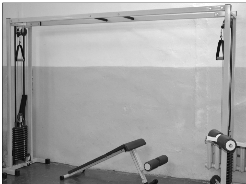
В тренажерном зале кроссовер занял полстены. Молодежь предпочитает заниматься именно на нем, так как новый тренажер прокачивает все группы мышц человеческого организма.

тренажерного зала и кабинета лечебной физической культуры. «Денежные средства в размере 500 тысяч рублей позволили улучшить спортивную базу школы», – говорит он.